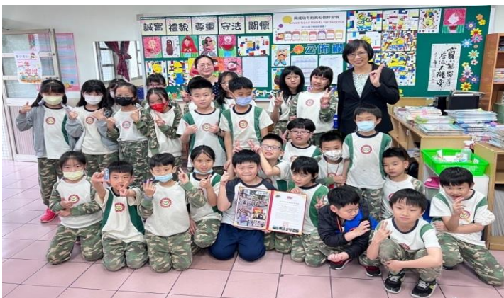
中道接待家庭學生歡送日本東京中華學校學生