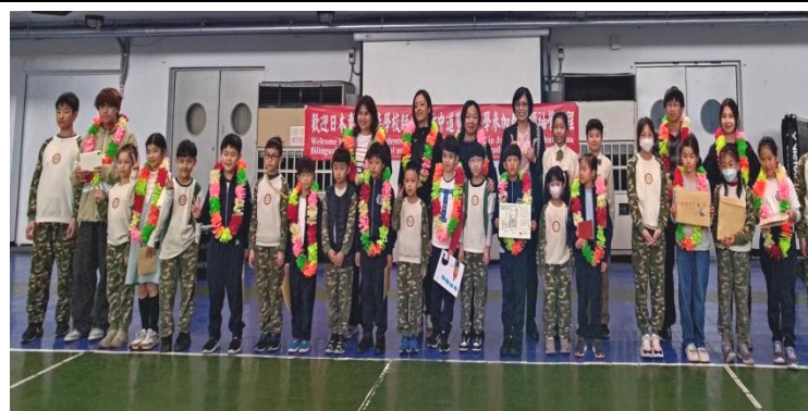
3/20 迎賓活動中道接待家庭與日本東京中華學校學生合影

週末の休暇中、日本の生徒たちはホストファミリーに引率され、宜蘭の有名な史跡を訪ねたり、地元のグルメを味わったりと、忘れられない文化旅行を楽しみました。この活動は日本人生徒にとって実り多いものであっただけでなく、宜蘭中道バイリンガル小学校の教師と生徒、そしてホストファミリーの間に深い友情と相互信頼が築かれました。この文化交流活動の成功は、両国の生徒の学習経験を豊かにするだけでなく、中日両国の文化交流と友好協力の促進のための強固な基礎を築いた。