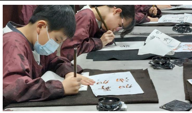
日本東京中華學校學生體驗書法課